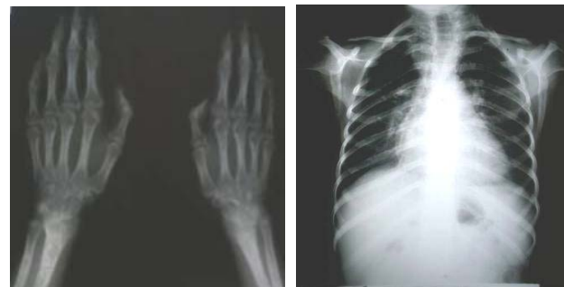
شکل-۳: عکسهای رادیولوژی بیمار

با توجه به یافته‌های بالینی خاص بیمار شامل کوتاهی قد، آترواسکلروز زودرس و ظاهر پیر (premature aging) در بانک اطلاعاتی Medline با استفاده از کلمات کلیدی فوق جستجو صورت گرفت. تشخیص‌های احتمالی شامل سندرم‌های HGPS , Werner و Metageria مطرح می‌باشند. قندهای ناشتای طبیعی، کوتاهی قد قابل توجه، استئولیز، بیماری قلبی در سنین پایین، عدم وجود کاتاراکت و عدم سابقه خانوادگی بیماری مشابه بر علیه تشخیص سندرم ورنر می‌باشد. کوتاهی قد، عدم وجود دیابت، عدم وجود ضایعات پوستی Poikiloderma و عدم وجود علائم ایسکمی اندام‌ها در این بیمار برخلاف تشخیص سندرم متاگریا می‌باشد. با توجه به تطابق یافته‌های بالینی با موارد مشابه تشخیص بیماری براساس شجره‌نامه و شرح حال بیمار و یافته‌های بالینی و آزمایشگاهی به نفع HGPS می‌باشد. ۳ شیوع سندرم پروجریا هوچینسون گیلفورد، یک در هشت