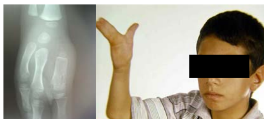
شکل - ۱: بیمار ۱۲ ساله با سینداکتیلی انگشتان