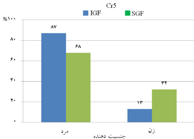
نمودار-۲: مقایسه فراوانی SGF در دو گروه با دهنده مذکر و مؤنث