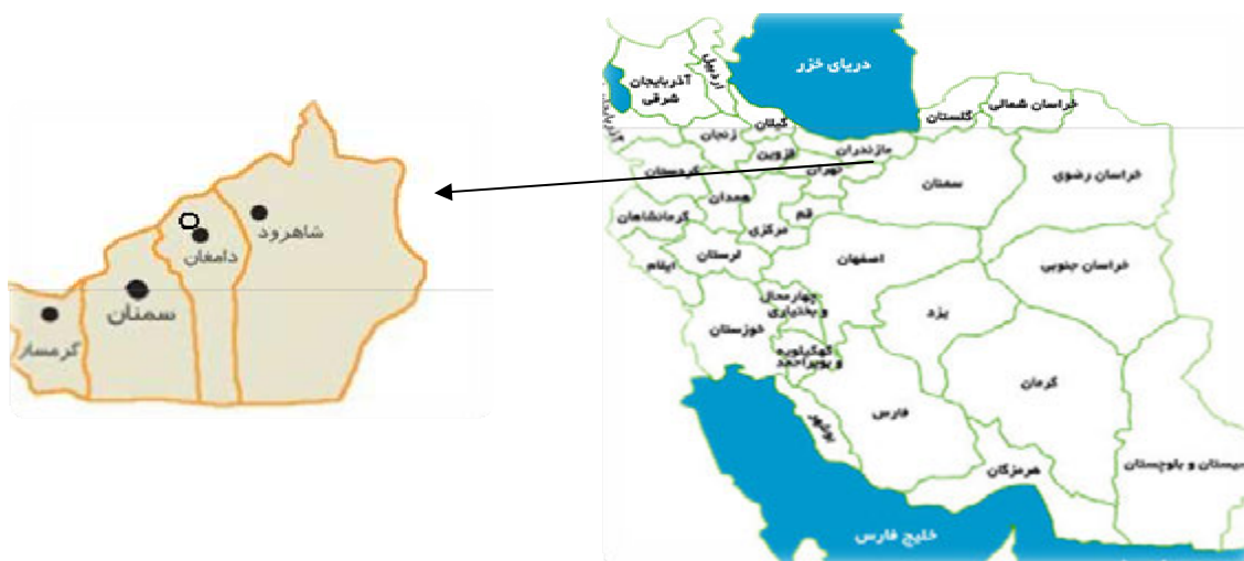
شکل ۱- منطقه مورد مطالعه در شهرستان دامغان

منطقه مورد مطالعه (قرق و غیرقرق) در استان سمنان و شهرستان دامغان واقع شده است. عملیات قرق در مرتع شاه تپه-چاه محمود به مدت ۸ سال انجام شده در صورتی که مرتع چیرو فاقد قرق، تحت چرای شدید گوسفند و سیستم چرای باز می باشد. مرتع قرق شده با