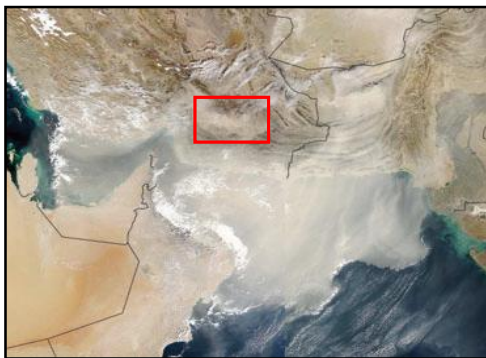
شکل ۵. طوفان‌های گرد و غبار ۱۳ دسامبر ۲۰۰۳ بر روی دریای عمان، سواحل مکران و پلایای جازموریان، (SEAWIFS)

فلدسپات کانی سوم و در حاشیه پلایا کانی اول به شمار می‌آید)، تشکیل کائولینیت به صورت اتوزن در پلایا را ثابت می‌کند. آنالیز XRD رسوبات دریاچه نمک ( Sambhar salt Lake) در هند نشان دهنده پیک کائولینیت می‌باشد که هوازگی کانی‌های مافیک و فلدسپات‌ها را به عنوان منشأ کائولینیت پیشنهاد می‌کند (Sinha & Raymahashay, 2004). پالی گورسکیت به عنوان کانی رسی پنجم فقط در بخش غربی پلایا و حاشیه غربی آن مشاهده می‌گردد. با توجه به محدود بودن گستره پراکنش پالی گورسکیت، منشأ این کانی رسی بادی است که اغلب از سمت غرب، حوضه جازموریان را تحت تأثیر قرار می‌دهد. لازم به یادآوری است که بخشی از سایر کانی‌های رسی و حتی کانی‌های کوارتز، فلدسپات و کلسیت نیز با توجه به دانه ریز بودن می‌توانند توسط باد از سایر حوضه‌ها وارد جازموریان گردند. با این حال وجود الگوی منظم پراکنش کانی در پلایا نشانگر تأثیر بسیار کم رسوبات بادی سایر حوضه‌های رسوبی در این حوضه است (شکل-۵). ذرات بین ۲۰ تا ۷۰ میکرون قابلیت حمل توسط باد به صورت معلق ولی برای مدت زمان کمی را دارا هستند. ذرات کوچکتر از ۲۰ میکرون بصورت معلق، برای مدت زمان زیاد و در فواصل بسیار دور توسط باد حمل می‌گردند.