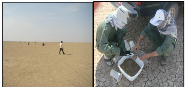
شکل ۳. نمونه برداری از رسوبات سطحی پلاپای جازموریان

نمونه‌های رسوب تهیه شده از جازموریان مخلوطی از نمونه‌های برداشت شده به صورت شبکه منظم ۵ در ۵ متر است. در حقیقت هر نمونه مخلوط ۶۴ نمونه رسوب سطحی است که ۱۶۰۰ متر مربع را پوشش می‌دهد. بدین صورت که ۸ نفر به فواصل ۵ متری از هم با یک قاشق پلاستیکی، سطح زمین به ضخامت ۱ سانتی متر را کنار زده و از زیر آن نمونه برداشت می‌کنند. هر فرد ۸ نمونه رسوبی برداشت شده را در داخل بشر ریخته مخلوط می‌نماید. پس از اتمام نمونه برداری تمام نمونه‌ها در داخل لگن ریخته شده و مخلوط می‌گردند، ذرات درشت جدا شده و در آخر نمونه‌ها مخلوط شده و به چهار قسمت جدا می‌گردد دو قسمت مخلوط شده و نمونه از آن برداشت می‌شود (شکل ۳). در این مطالعه ۲۶ نمونه رسوب سطحی جهت مطالعات رسوب‌شناسی و ژئوشیمی رسوبی برداشت گردید.