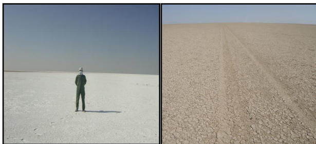
شکل ۲. پهنه‌های گلی و کفه نمکی (شمال شرق) پلایای جازموریان

در جهت شمال غربی - جنوب شرقی تپه‌های ماسه‌ای کوتاه طولانی و پراکنده و رشته‌های سطحی ماسه‌ای که بازوی آنها به طرف جنوب شرقی ختم می‌شوند نشان می‌دهد که جهت بادهای غالب این منطقه از طرف شمال غرب است. با وجود این تپه‌های قوسی موجود در حد غربی جازموریان، وجود بادهای غربی غالب را تأیید می‌کند. با توجه به اینکه جهت تپه‌های ماسه‌ای عظیم و تثبیت شده متعلق به عصر یخبندان نیز با جهت تپه‌های فعلی یکسان است، می‌توان تصور نمود که جهت بادهای غالب از پلیستوسن تا به حال تغییر نکرده است. خط ساحلی بلند موجود در اطراف حاشیه‌های شمالی و جنوبی منطقه خیس فعلی نشان می‌دهد که سطح این دریاچه در گذشته بسیار وسیع تر بوده است (با توجه به میزان رسوباتی که از زمان پلیستوسن تا به حال در این دریاچه به جای مانده است). خط ساحلی قدیمی که ۱۰ متر بالاتر از سطح فعلی دریاچه است نشان می‌دهد که عمق این دریاچه در گذشته به مراتب بیشتر از پلایای کم عمق کنونی بوده است. چنین به نظر می‌رسد که فرونشست جازموریان در عصر یخبندان به وسیله دریاچه‌ای بزرگ و متغیر پوشیده بوده است. بستر این فرورفتگی را مواد رسی و سیلتی آبرفتی و دریاچه‌ای فرا گرفته است (پاشائی، ۱۳۸۱) (شکل ۲).