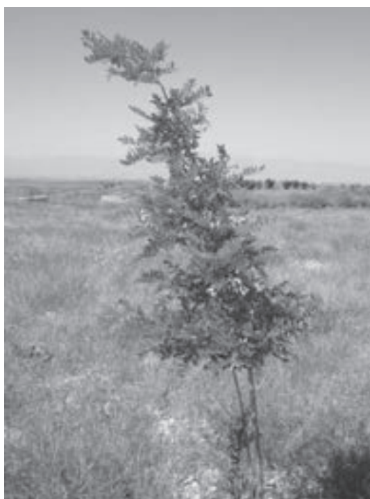
شکل ۷- یکی از نهال‌های افاقیا با رشد مناسب در زمان گلدهی در محل دوم کانال پنجم