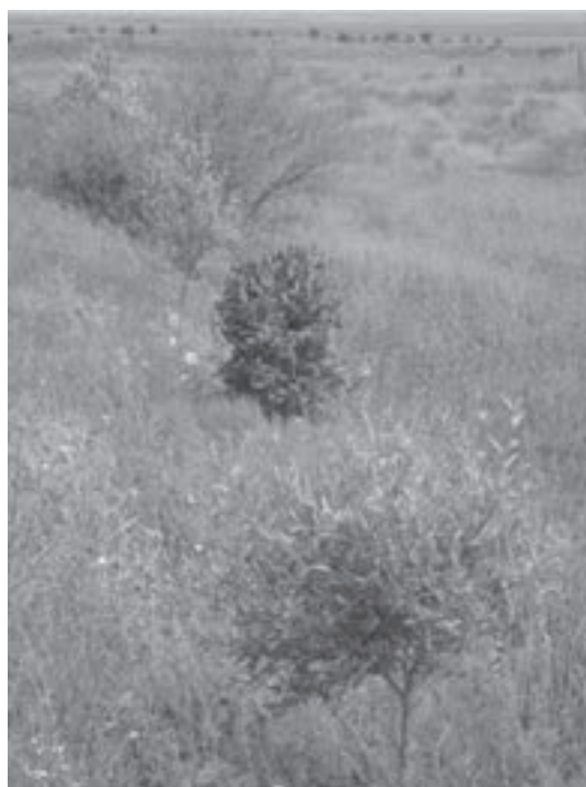
شکل ۵- نهال‌های کشت شده در محل سوم کانال پنجم