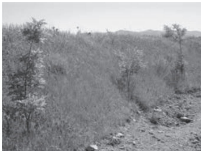
شکل ۸- زنده مانی و رشد مناسب نهال‌های افاقیا در محل چهارم کانال پنجم