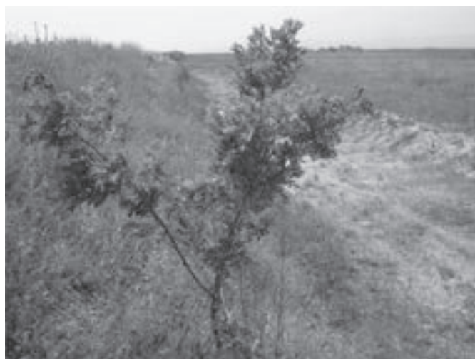
شکل ۲- رشد مناسب افاقیا محل چهارم کانال پنجم