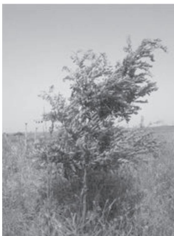
شکل ۳- یکی از نهال‌های بادام با رشد مناسب در محل سوم کانال سوم