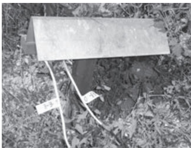
شکل ۹- استقرار حسگرهای اندازه گیری رطوبت خاک