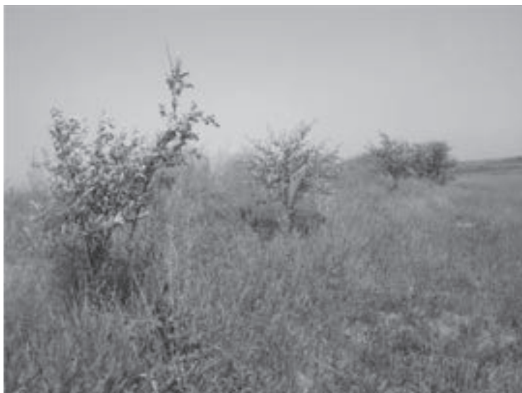
شکل ۶- زنده مانی و رشد مناسب نهال‌های سنجد در محل سوم کانال پنجم