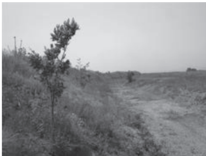
شکل ۴- نهال‌های کشت شده در محل چهارم کانال سوم