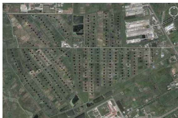
شکل ۱- تصویر ماهواره‌ای از اراضی شالیزاری مورد مطالعه و محل‌های نمونه‌برداری.

مشخصات ناحیه مورد مطالعه، الگوی نمونه‌برداری و خواص خاکی اندازه‌گیری شده: منطقه مورد مطالعه اراضی شالیزاری مؤسسه تحقیقات برنج کشور واقع در شهرستان رشت به وسعت ۳۰۶ هکتار است که در عرض جغرافیایی ۳۷ درجه و ۱۶ دقیقه شمالی و طول جغرافیایی ۵۱ درجه و ۳ دقیقه شرقی با ارتفاع ۷ متر از سطح دریا قرار دارد. میانگین حداقل و حداکثر دمای سالیانه آن به ترتیب ۶/۶ و ۲۵ درجه سانتی‌گراد و بارش سالیانه آن ۱۲۰۰ میلی‌متر می‌باشد. از نظر واحد فیزیوگرافی منطقه مورد مطالعه قسمتی از دشت رسوبی کوهپایه‌ای Piedmont alluvial plain محسوب می‌شود که مواد مادری آن رسوبات رودخانه‌ای است که از کوه‌های البرز حمل گردیده و ته‌نشین شده است (محمدی، ۱۹۷۱). بیش‌تر اراضی شالیزاری مؤسسه تحقیقات برنج هر ساله توسط زارعان زیر کشت برنج قرار می‌گیرد و بیش‌تر زارعان برای تولید بیش‌تر از کودهای نیتروژنه (اوره) استفاده می‌کنند اما مصرف کودهای فسفوره (سوپرفسفات تریپل) و پتاسه (سولفات پتاسیم) به شکل غیریکنواخت و در برخی مواقع انجام می‌گیرد. بخش دیگری از اراضی مؤسسه نیز برای اجرای آزمایش‌های تحقیقاتی و تولید بذر مادری استفاده می‌گردد که در آن‌ها مصرف کود بر پایه اهداف فعالیت‌های تحقیقاتی است. در این مطالعه در یک الگوی نمونه‌برداری شبکه‌ای منظم به ابعاد ۵۰×۱۰۰ مترمربع از ۳۷۰ نقطه از خاک‌های سطحی (به عمق ۰-۳۰ سانتی‌متر) نمونه‌برداری خاک انجام گرفت (شکل ۱).