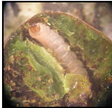
شکل ۲- لارو شب‌پره Argyroresthia praecocella در حال تغذیه از گوشت میوه (اصل)