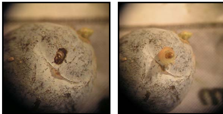
شکل ۳- سوراخ خروجی لارو سن آخر (راست) و لارو کامل در حال خروج از میوه (چپ) (اصل)