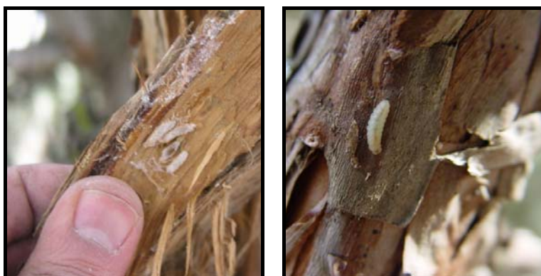
شکل ۴- لارو سن آخر (راست) و پیش شفیره آفت در زیر پوستک درختان میزبان (چپ) (اصل)

براساس اطلاعات جمع‌آوری شده از نمونه‌برداری‌های ۳ ساله، دوره زندگی پروانه میوه‌خوار ارس روی درخت ارس در منطقه طارم استان قزوین مطابق جدول ۱ می‌باشد.