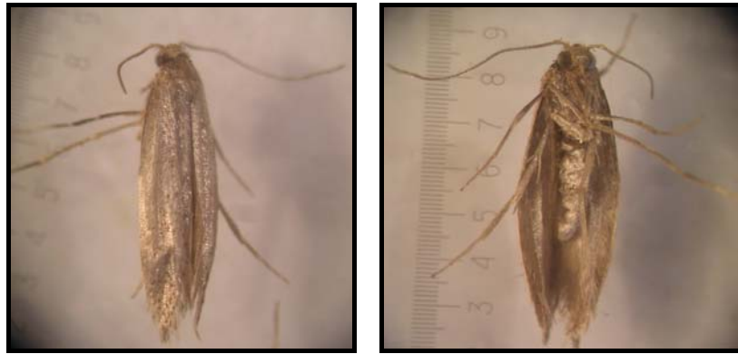
شکل ۱- حشره کامل پروانه میوه‌خوار ارس ( A. praecocella ) از سطح شکمی (راست) و سطح پشتی (چپ) (اصل)