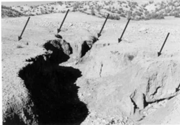
شکل ۳- نمایی از پلان شاخه‌ای سر خندق در منطقه سرقلعه

در گروه دوم که مناطقی با اقلیم‌های مرطوب و خیلی مرطوب را شامل می‌شود، سازند غالب زمین‌شناختی کوتاه‌تر و میشان است. میانگین طول خندق‌ها ۱۲۶۰ متر و میانگین عرض بالا و پایین آن‌ها به ترتیب ۷/۷ و ۲/۷ متر می‌باشد. میانگین عمق خندق‌ها ۲/۷ متر و میانگین عمق پیشانی آن‌ها ۱/۳ متر است. پلان عمومی خندق‌ها در این گروه فقط به صورت خطی و پلان سر آن‌ها به دو صورت نقطه‌ای و نوک‌دار است. شکل مقطع عرضی خندق‌ها فقط به صورت دوزنقه‌ای و نیم‌رخ طولی سر آن‌ها به دو صورت مایل و عمودی است (شکل ۴). میانگین شیب حوزه آبخیز واقع در بالادست رأس خندق‌ها در این گروه ۱۰ درصد است.