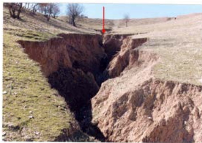
شکل ۴- نمایی از نیم‌رخ طولی پیشانی خندق که به صورت عمودی می‌باشد (منطقه بارز)

در گروه دوم که مناطقی با اقلیم‌های مرطوب و خیلی مرطوب را شامل می‌شود، سازند غالب زمین‌شناختی کوتاه‌تر و میشان است. میانگین طول خندق‌ها ۱۲۶۰ متر و میانگین عرض بالا و پایین آن‌ها به ترتیب ۷/۷ و ۲/۷ متر می‌باشد. میانگین عمق خندق‌ها ۲/۷ متر و میانگین عمق پیشانی آن‌ها ۱/۳ متر است. پلان عمومی خندق‌ها در این گروه فقط به صورت خطی و پلان سر آن‌ها به دو صورت نقطه‌ای و نوک‌دار است. شکل مقطع عرضی خندق‌ها فقط به صورت دوزنقه‌ای و نیم‌رخ طولی سر آن‌ها به دو صورت مایل و عمودی است (شکل ۴). میانگین شیب حوزه آبخیز واقع در بالادست رأس خندق‌ها در این گروه ۱۰ درصد است.