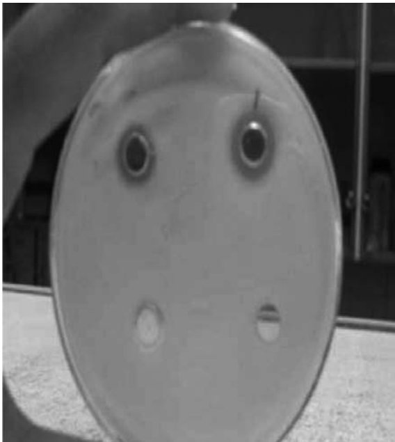
شکل ۳. اثر سوسپانسیون پروبیوتیکی و اسیدهای آلی با pH خنثی در مهار رشد اشریشیا کلی O157:H7: اطراف چاهک های حاوی اسید آلی (دو چاهک پایین) در مقایسه با چاهک حاوی پروبیوتیک (دو چاهک بالا) رشد باکتری ممانعت نشده است.

کلی O157:H7 نمی تواند باشد (۱۵). به همین دلیل در این پژوهش ما نیز اثر آنتاگونیسمی اسیدهای آلی بر رشد باکتری اشریشیا کلی O157:H7 مورد بررسی قرار دادیم. نتایج نشان داد که اسیدهای آلی نمی توانند اثر قابل ملاحظه ای بر علیه این باکتری ایجاد نمایند. به نظر می رسد که عوامل دیگری مانند باکتریوسین ها، تولید و ترشح متابولیت های آلی و گلیکولپیدهایی با فعالیت بیولوژیک قوی در اثر مهار بر علیه این باکتری می تواند نقش تعیین کننده داشته باشد. اثر اسیدهای آلی و باکتریوسین ها و متابولیت های آلی تولید شده توسط پروبیوتیک ها علیه اشریشیا کلی O157:H7 روی رده سلولی ورو نیز بررسی شد و نتایج مشابهی حاصل گردید. متابولیت های آلی تولید شده حتی زمانی که pH محیط خنثی شد مانع تخریب رده سلولی ورو توسط اشریشیا کلی O157:H7 گردید (نتایج در این مقاله ذکر نشده است).