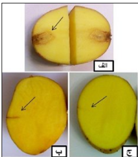
شکل ۲: کنترل پوسیدگی نرم ناشی از Pcc توسط عصاره گیاهی شوید. الف) تلقیح Pcc به طور مستقیم. ب) تلقیح ترکیب عصاره گیاهی و پاتوزن. ج) تلقیح آب استریل.