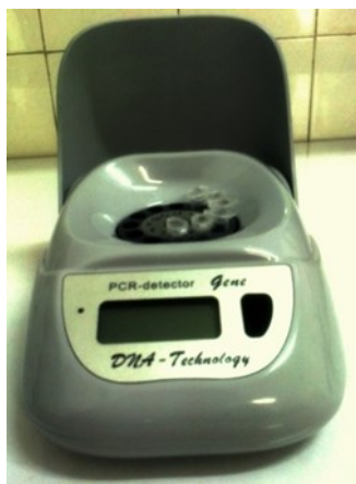
شکل ۱: دستگاه ردیاب فلوروست.

در این مطالعه حداقل سن افراد شرکت کننده ۱۹ و حداکثر ۴۹ سال بود. همچنین میانگین سنی افراد ۳۰ سال با انحراف معیار ۷/۰۳۸ بود. گروه سنی ۱۹-۲۹ سال بیشترین فراوانی را داشتند. ۳۶ نفر (۳۶٪) از افراد تحت بررسی قبلاً عفونت واژن، ۶ نفر (۶٪) سابقه سقط جنین و ۱ نفر (۱٪) سابقه حاملگی خارج رحمی داشته اند.