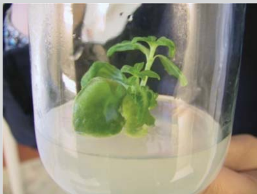
شکل ۱- دانه رست‌های گل آهار ( Zinnia elegans thumbelina ) در شیشه (in vitro)