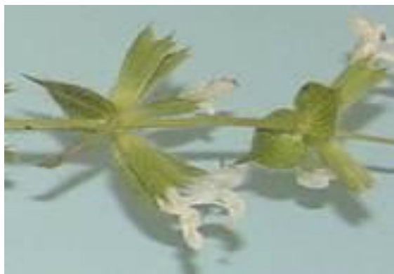
شکل ۱۲. گل آذین گیاه S. macrosiphon (×۴)