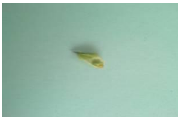
شکل ۱۸. میوه گیاه S. macrosiphon (×۴)

شده است و تعداد زیادی از این سلول ها تمایز پیدا کرده و تبدیل به کرک شده اند و کرک ها به صورت راست غده ای می باشند. در زیر بشره آن ها پارانشیم وجود دارد که ۳ تا ۴ لایه خارجی آن ها از سلول های فشرده و بدون مه آ و بقیه از سلول های درشت ترومه آدار است. این سلول ها در داخلی ترین لایه کاملاً فشرده بودند. در زیر بشره هر یک از گوشه ها بافت کلانشیم به صورت متراکم وجود داشت.