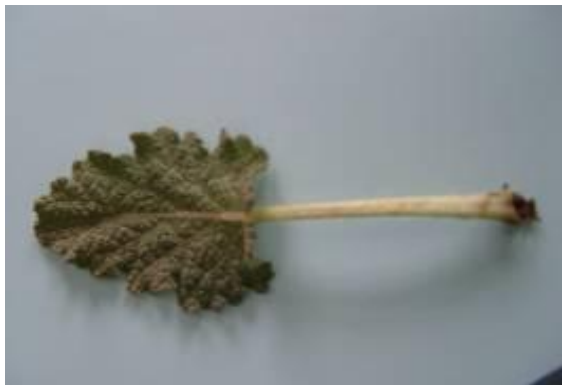
شکل ۴. برگ گیاه S. macrosiphon