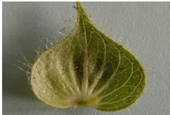
شکل ۱۳. براکته گیاه S. macrosiphon (×۴)