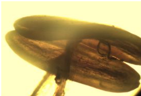
شکل ۱۶. بساک گیاه S. macrosiphon (×۴)