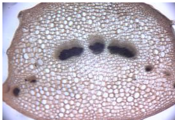
شکل ۲۱. برش عرضی دمبرگ گیاه S. macrosiphon (×۱۰)

در بررسی های ساقه، در سطح خارجی اپی‌درم کوتیکول مشاهده شد. با توجه به ارتفاع محل رویش و با توجه به کوهستانی بودن منطقه محل رویش، علت وجود لایه کوتیکول را می توان عامل اصلی جهت مقاومت نسبت به سرما و خشکی و تابش شدید نور خورشید دانست. بافت کلانشیم موجود در زوایای ساقه چهار گوش در این گونه باعث استحکام ساقه شده تا بتواند حالت طبیعی و برافراشتهگی خود را حفظ کند. نحوه ی استقرار دستجات آوندی در ساقه با دم- برگ مطابقت دارد و این مسأله نشان دهنده آن است که دستجات آوندی دم برگ از انشعابات دستجات آوندی ساقه حاصل شده است. ساختار و تراکم کرک ها در قسمت های مختلف ساقه و برگ کاملاً متفاوت بود. این مسأله بیان کننده این است که کرک ها در مراحل