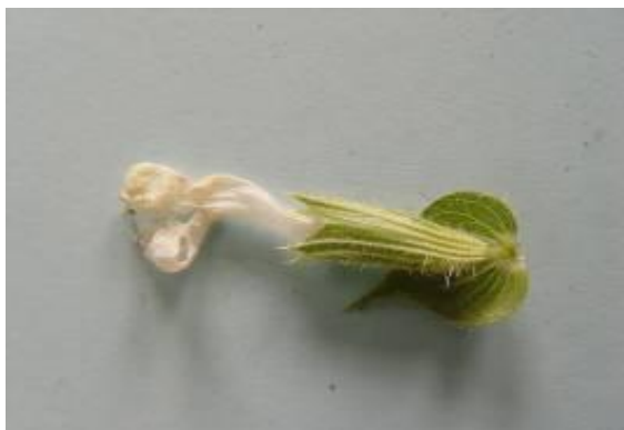
شکل ۱۱. گل گیاه S. macrosiphon