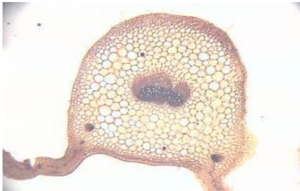
شکل ۲۲. برش عرضی برگ گیاه S. macrosiphon (×۱۰)

ترشگی بودند که هر دو نوع این کرک ها دارای یک ردیف سلول با اندازه متفاوت بودند و سلول تحتانی درشت تر بوده و به اپی‌درم مربوط می باشد.