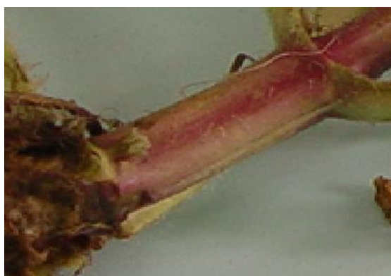
شکل ۳. سطح کرک‌دار ساقه گیاه S. macrosiphon