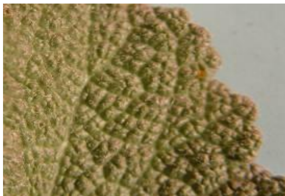
شکل ۷. حاشیه برگ گیاه S. macrosiphon (×۴)