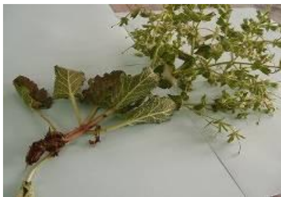
شکل ۲. ساقه گیاه S. macrosiphon