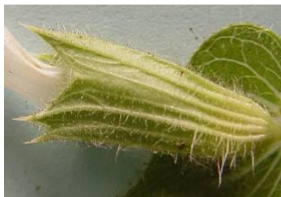
شکل ۱۵. کاسبرگ گیاه S. macrosiphon (×۴)

اپی درم شامل یک ردیف سلول مستطیلی شکل بود. این سلول ها از خارج به داخل تحدب داشته و برخی جدار خارجی آن ها کوتینی