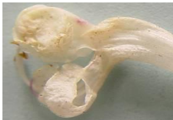
شکل ۱۴. جام گل گیاه S. macrosiphon (×۴)