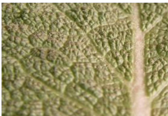
شکل ۵. کرک‌های سطح رویی برگ گیاه S. macrosiphon (×۴)