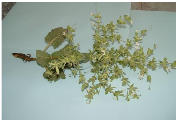
شکل ۱. تصویر گیاه S. macrosiphon