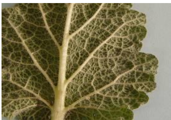
شکل ۶. کرک‌های سطح زیرین برگ گیاه S. macrosiphon (×۴)