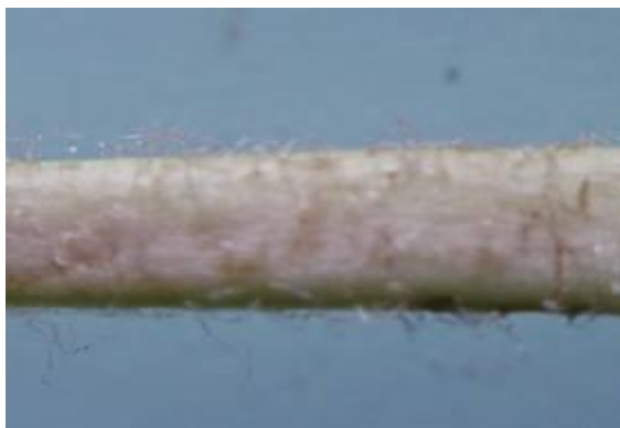
شکل ۱۰. دم‌برگ کرکدار گیاه S. macrosiphon (×۴)