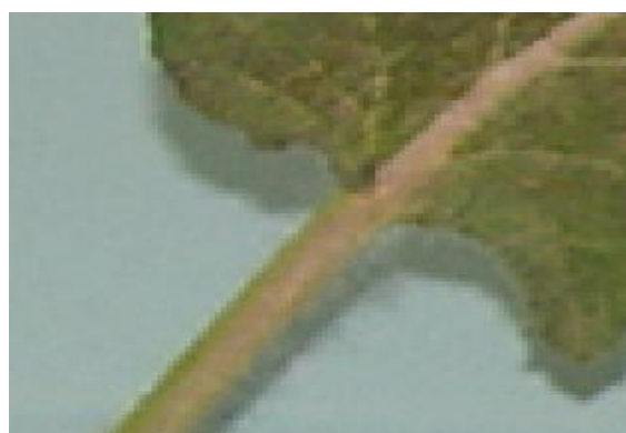
شکل ۹. قاعده برگ گیاه S. macrosiphon (×۴)