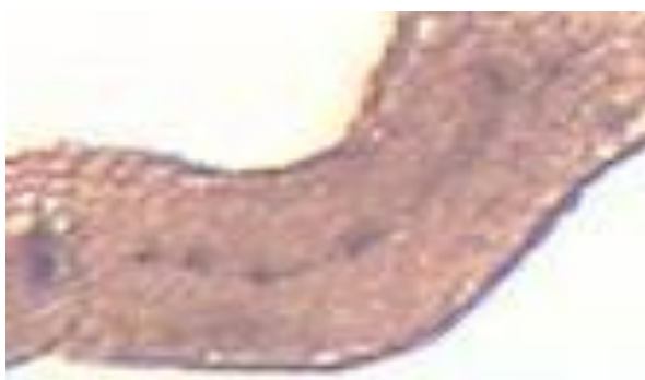
شکل ۲۳. مزوفیل برگ گیاه S. macrosiphon (×۱۰)

در بررسی های ساقه، در سطح خارجی اپی‌درم کوتیکول مشاهده شد. با توجه به ارتفاع محل رویش و با توجه به کوهستانی بودن منطقه محل رویش، علت وجود لایه کوتیکول را می توان عامل اصلی جهت مقاومت نسبت به سرما و خشکی و تابش شدید نور خورشید دانست. بافت کلانشیم موجود در زوایای ساقه چهار گوش در این گونه باعث استحکام ساقه شده تا بتواند حالت طبیعی و برافراشتهگی خود را حفظ کند. نحوه ی استقرار دستجات آوندی در ساقه با دم- برگ مطابقت دارد و این مسأله نشان دهنده آن است که دستجات آوندی دم برگ از انشعابات دستجات آوندی ساقه حاصل شده است. ساختار و تراکم کرک ها در قسمت های مختلف ساقه و برگ کاملاً متفاوت بود. این مسأله بیان کننده این است که کرک ها در مراحل