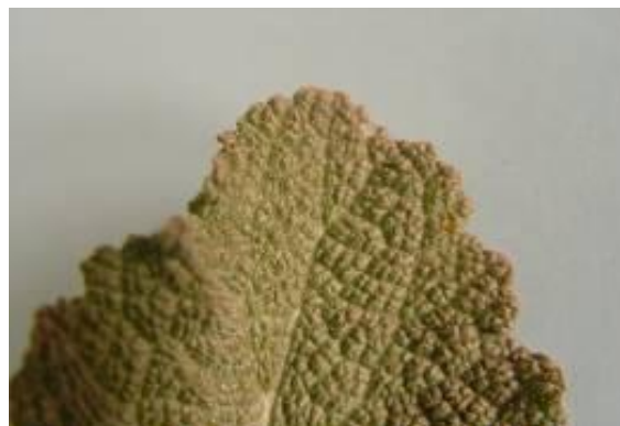
شکل ۸. نوک برگ گیاه S. macrosiphon (×۴)