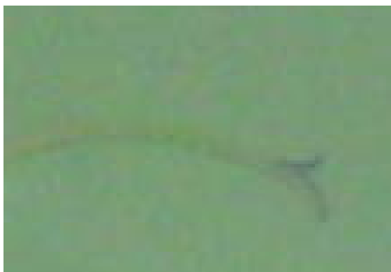
شکل ۱۷. کلاله گیاه S. macrosiphon (×۴)