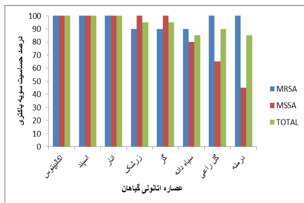
نمودار ۱. مقایسه فعالیت عصاره اتانولی گیاهان مؤثر علیه سویه‌های MRSA و MSSA

به طور ۱۰۰ درصد مؤثر بود. ۴ میلی‌گرم از عصاره اتانولی گز و زرشک علیه ۵ سویه MSSA به طور ۱۰۰ درصد مؤثر بود (نمودار ۱) و با به دست آوردن MIC گیاهان دارویی مؤثر علیه سویه‌های MRSA و MSSA مشخص شد که تقریباً همه این گیاهان در غلظت‌های پایین نیز در برابر این سویه‌ها اثر بسیار خوبی دارند (جدول ۲).