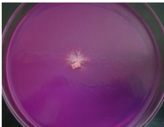
شکل ۲- تشکیل سکتور F.oxysporum در محیط زاپک کلرات (شکل از نگارنده)