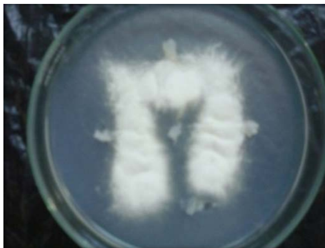
شکل ۱ - رشد هتروکاریون F. oxysporum در آزمون مکمل سازی (اصلی)