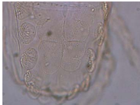
شکل ۳- صفحه هیستروزومایی در کنه ماده Microcheyla parvula Figure 3. Microcheyla parvula , Hysterosomal shield of female