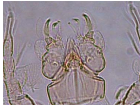
شکل ۱- گناتوزوما در کنه ماده Microcheyla parvula Figure 1. Microcheyla parvula , Gnathosoma of female