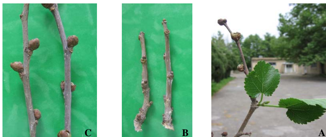
شکل ۲- A: جوانه‌های آلوده به کنه‌ی A. mori ؛ B: جوانه‌های سالم؛ C: جوانه‌های آلوده به کنه در فصل رویش (عکس‌ها اصلی)

سبب ضرر و زیان به باغ‌داران و نوغان‌داران می‌گردد (شکل ۲). با توجه به این که روش‌های تکثیر این درخت مبتنی بر تهیه‌ی پیوندک و همچنین قلمه از درخت مادری می‌باشد استفاده از جوانه‌های سالم ضروری است. بنابراین تشخیص جوانه‌های آلوده به این کنه، نقش مهمی در ازدیاد گیاه در فصل رشد دارد که باغ‌داران در سال بعد یا دو سال بعد متوجه باز نشدن جوانه‌ها می‌گردند. پیشنهاد می‌گردد شاخه‌های دارای جوانه‌های سالم روی درخت مادری حتما در تابستان علامت‌گذاری شده و در فصل مناسب از همین شاخه‌های علامت‌گذاری شده نسبت به تهیه‌ی پیوندک اقدام شود. همچنین در صورت مشاهده‌ی نهال‌های یک‌ساله و دوساله که برخی از جوانه‌های آن متورم و باز نشده‌اند، جهت جلوگیری از شیوع کنه و انتشار آن، نسبت به حذف و سوزاندن آن نهال از نهالستان اقدام گردد. با توجه به مصرف برگ درخت توت برای تغذیه‌ی دام، پرورش کرم ابریشم، تازه خوری میوه و تهیه‌ی خشکبار، مبارزه‌ی شیمیایی علیه این کنه توصیه نمی‌گردد.