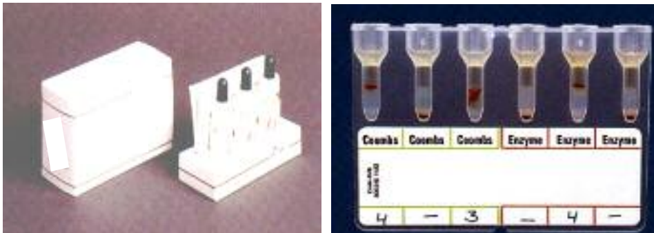
شکل ۱: نمونه لوله‌های سلول‌های غربالگر (۳، ۲، ۱: Dia cell) و محیط ژل که در دو سیستم Liss coombs و آنزیم انجام می‌شود

مشخص (cell 1P & 2P & 3P) بودند، استفاده شد. مراحل انجام آزمایش و نحوه انکوباسیون و سانتریفوژ همانند آزمایش غربالگری انجام شد و پس از پایان مراحل ذکر شده، الگوی واکنش با استفاده از جدول همراه پانل‌ها خوانده و نوع آنتی‌بادی مشخص شد (شکل ۳).