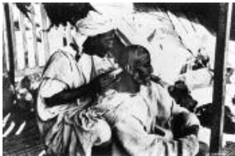
شکل ۴: حجامت در مراکش که از ظروف نقره برای جمع‌آوری خون استفاده شده است (۸).

گذشته و حتی حال استفاده کرده‌اند. افراد مورد مطالعه به ارتباط بین حجامت سنتی و خونگیری غربی (Western blood sampling) اشاره کردند. از نظر آنان خونگیری مدرن، سبب ایجاد نتیجه‌ای مشابه با حجامت می‌باشد و به همین جهت این بیماران به طور مکرر از پزشک خود درخواست انجام آزمایش می‌کنند.