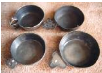
شکل ۲: نمایی از ظروف جمع‌آوری خون در حجامت (۱۸۵۰-۱۷۷۰) (۱۰)

در اواسط قرن ۱۸ به نظر می‌رسد که گرفتن خون روش استاندارد برای درمان تب به حساب می‌آمده، هر چند که این روش برای درمان تب‌های عفونی مانند تیفوئید یا تیفوس کاربردی نداشته است (۸). خونگیری تا پرشدن یک لگن ادامه می‌یافت که تقریباً معادل ۲۰ اونس (۵۸۰ میلی‌لیتر) است و این میزان می‌توانست تا ۲۵ اونس (۷۲۰ میلی‌لیتر) ادامه یابد. اولین خونگیری تا زمانی که بیمار از حال برود (Faint) ادامه داشت (شکل ۲) (۹).