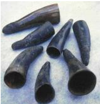
شکل ۸: شاخ حیوانات که برای حجامت استفاده می‌شد (۱۵).

ابتدا پوست تمیز می‌شد و شاخ گاو در محل مکش قرار می‌گرفت. دهانه شاخ محل مکیدن بود، سپس برای چند لحظه شاخ برداشته می‌شد و برش سطحی در محل ایجاد می‌شد. مجدداً شاخ گذاشته می‌شد و قسمت دهانه آن با شدت مکیده می‌شد. خون در شاخ انباشته گشته و زمانی که شاخ گاو از محل برداشته می‌شد، لخته‌های تیره خون به عنوان خون بد و کثیف به بیمار نشان داده می‌شد. سپس زخم به کمک پارچه خشک و آغشته به پودر گیاهی تمیز می‌شد (شکل ۸) (۱۵).