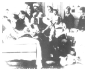
شکل ۱۲: انتقال خون در بیمارستان Bellevue نیویورک (۱۸۷۶) (۳۰)

درمان توسط خون (Hemotherapy) در سیر تکاملی خود از اهدافی مانند خارج ساختن شیطان و ارواح خبیث و کنترل اخلاط چهارگانه به تغییر خلق و خوی بد انسان‌ها رسید و پس از آن در حال حاضر به عنوان علمی جدید در رشته پزشکی به نام طب انتقال خون برای جایگزینی در کمبودهای خونی و به هنگام از دست دادن خون شناخته می‌شود که نیاز به تکامل بیشتری دارد (۲۷).