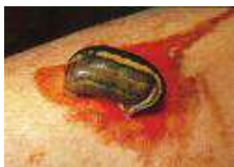
شکل ۹: خونگیری توسط زالو (۲۱)

هنوز در داروخانه‌های قدیمی آمریکا برای درمان زخم‌های ساده دیده می‌شدند (۲۳، ۲۲).