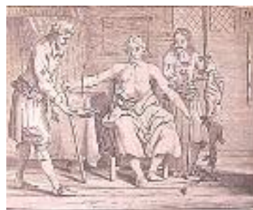
شکل ۱۰: تصویری از انتقال خون گوسفند به انسان (۱۶۹۳) (۲)