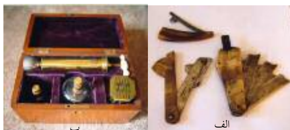
شکل ۵: الف: چند لانست با روکش شاخ حیوانات ب: جعبه وسایل حجامت انگلیسی (۱۰)

۴- خراش‌گذار (Scarificator): حامل فلزی با چندین لبه تیز تیغ‌دار (۷).