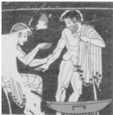
شکل ۱: پزشکی (ایاتروس) در حال حجامت بیمار (۴۸۰ تا ۴۷۰ قبل از میلاد) (۶)

حجامت توسط مصری‌های اطراف رود نیل، چند هزار سال قبل از میلاد مسیح به کار رفته و این سنت به یونان و روم گسترش یافته است که شاهد آن وجود یکی از قدیمی‌ترین اسناد موجود می‌باشد که در آن حجامت از ۳۳۰۰ سال قبل از میلاد مسیح، در مقدونیه انجام می‌شده است و بعدها از مقدونیه به یونان باستان رخنه کرده است (شکل ۱) (۴).