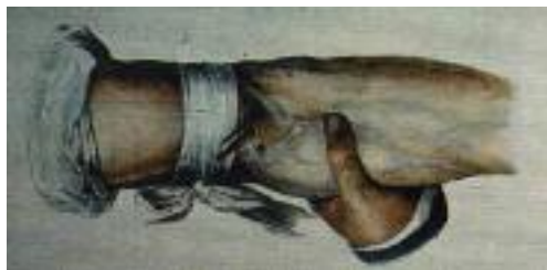
شکل ۷: خونگیری از ورید (۱۰)

ابزارهای به کار رفته شامل لانست و Fleam می‌باشند. لانست شستی کوچک با نوک تیز، ابزار جراحی است که برای فلوتومی انسان به کار می‌رفت. بازوی بیمار در بالای آرنج با یک نوار پارچه‌ای محکم بسته می‌شد تا ورید را فشار دهد. اما نه آن قدر محکم که نبض شریان را کاهش دهد. تیغه لانست بین شست و انگشت سبابه قرار می‌گرفت و دست با سه انگشت دیگر حمایت می‌شد. سپس لانست در یک جهت وارد ورید می‌شد تا خون از این نقطه بیرون آید. لبه فوقانی لانست در یک خط مستقیم کشیده می‌شد تا پوست را هم سایز ورید زخم کند.