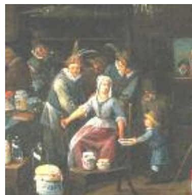
شکل ۳: جراحان در حال حجامت، اواخر قرن ۱۷ (۸)

درمان پر خونی [Plethora] احتمالاً پلی‌سایتمی [ در پاتولوژی دوران باستان همانند مجموعه قوانین شرعی و عرفی یهودیان بابلی (Talmud)، نقش بسیار مهمی داشته است. در آیین یهود، پزشکان به عنوان دانشمند و حجامت کنندگان به عنوان هنرمند شناخته می‌شدند. البته در همه نوشته‌های یهودیان، حجامت مورد تایید نیست، در انجیل نیز بریدن پوست کاملاً منع شده است (۱۱).