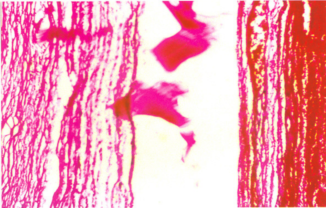
تصویر ۱: نمای ریزبینی مقاطع بانٹ تخمدان با استرومای سلولار و همورازیک با آلودگی به غشاء کوتیکولر لایه لایه کیست هیداتیک