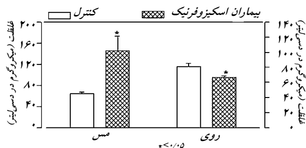
نمودار ۱: غلظت های پلاسمایی مس و روی در بیماران اسکیزوفرنیک و افراد گروه شاهد

غلظت پلاسمایی مس در بیماران اسکیزوفرنیک به طور معنی داری بیشتر از افراد گروه شاهد ( P<0/05 ) و غلظت پلاسمایی روی در بیماران اسکیزوفرنیک کمتر از افراد گروه شاهد ( P<0/05 ) بود (نمودار ۱).