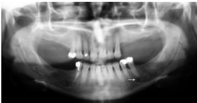
تصویر ۱: رادیوگرافی پانورامیک یکی از بیماران مورد مطالعه پیکان سفید، جایگاه سوراخ چانه‌ای را نشان می‌دهد.

متابولیسم استخوان (نارسایی موزن کلیوی، هایپرپاراتیروئیدیسم، آکرومگالی، هایپر تیروئیدیسم، بیماری‌های گاسترواینستینال، بیماری‌های بافت همبند و آرتریت روماتوئید)، هورمون‌تراپی (استروژن، پروژسترون و آندروژن) و استفاده از داروهای موثر بر متابولیسم استخوان (کورتیکواستروئیدها، داروهای ضد تشنج، سیکلوسپورین و هپارین) بود. پس از توضیح آزمایش سنجش تراکم استخوان و کسب رضایت نامه کتبی از بیمار، پرسشنامه‌ای که شامل مشخصات فردی از جمله سن، وزن، قد و BMI بود، برای هر بیمار تکمیل شد. سپس همه رادیوگرافی‌های پانورامیک با دستگاه Planmeca مدل CC 2002 (ساخت فنلاند) به وسیله یک نفر (دستیار سال سوم رادیولوژی دهان و فک و صورت) تهیه شد. موقعیت سر بیمار و همچنین عوامل تابش (kVp, mA) دستگاه برای هر بیمار به طور اختصاصی تنظیم شد. برای کسب دانسیته و کنتراست یکسان در کلیه رادیوگرافی‌ها از ترکیب فیلم پانورامیک آگفا (ساخت آلمان) و اسکرین کداک (Lanex, Regular Speed) استفاده شد و ظهور و ثبوت تمام فیلم‌ها به طور اتوماتیک با کمک پروسور نوع protec (ساخت آلمان)، انجام گرفت. اندازه‌گیری شاخص چانه‌ای به وسیله یک نفر متخصص رادیولوژی دهان و فک و صورت با استفاده از پرگار و کولیس با دقت ۰/۱ میلی‌متر انجام و در پرسشنامه ثبت گردید. برای از میان برداشتن اختلاف اندازه‌گیری مشاهده کنندگان مختلف، کلیه اندازه‌ها به وسیله یک نفر تعیین و ثبت شد.