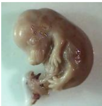
شکل ۲: بروز اگزوفتالمی و باز بودن پلک‌ها قبل از رنگ‌آمیزی در جنین در معرض داروی کاربامازپین از گروه تجربی I (دوز ۱۵ mg/kg)

یافته‌های بافتی نشان داد که اپی‌تلیوم قرنیه در نمونه‌های قرار گرفته در معرض دارو، چین خورده و اغلب باریک شده‌اند. عدسی کوچک بوده و تغییر شکل یافته و شبکیه نیز حالت چین خورده داشته و لایه‌های آن تمایز نیافته بودند (شکل ۳).