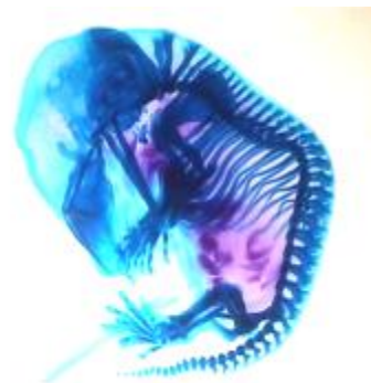
شکل ۴: انواع ناهنجاری‌های اسکلتی در جنین با استفاده از رنگ‌آمیزی آلزارین رد و آلسین بلو