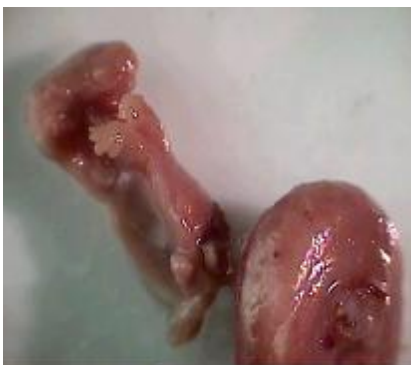
شکل ۱: ناهنجاری شدید جنین در معرض داروی کاربامازپین از گروه تجربی II (دوز ۳۰ mg/kg)

یافته‌های بافتی نشان داد که اپی‌تلیوم قرنیه در نمونه‌های قرار گرفته در معرض دارو، چین خورده و اغلب باریک شده‌اند. عدسی کوچک بوده و تغییر شکل یافته و شبکیه نیز حالت چین خورده داشته و لایه‌های آن تمایز نیافته بودند (شکل ۳).