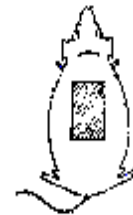
شکل ۱: تصویر شماتیک قالب مورد استفاده برای ایجاد سوختگی در ناحیه پشت موش و نمایش موش پس از ایجاد سوختگی