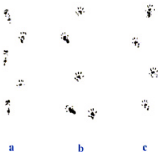
شکل شماره ۱- تصویر اندام عقب (Toes print) موش های گروه های مختلف هنگام راه رفتن جهت اندازه گیری SFI، دوازده هفته پس از ترمیم a) Collagen gel + PVDF b) Autograft c) Control

دهم، مقدار SFI در گروه های آزمایشی تغییر زیادی نداشت (شکل شماره ۱).