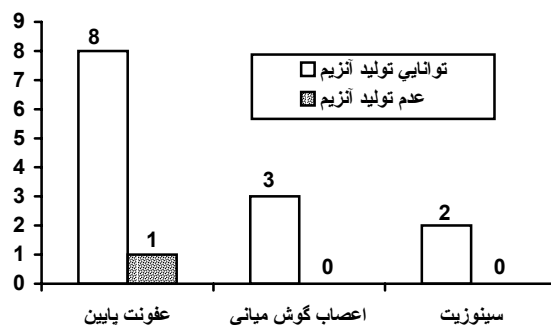
نمودار شماره ۳- فراوانی سویه‌های مولد بتالاکتاماز در بین موراکسلا کاتارالیس های ایزوله شده

بعد از سنجش حساسیت نسبت به آنتی بیوتیکها بر روی سویه‌های مقاوم به پنی‌سیلین حتما باید تست تولید آنزیم بتالاکتاماز صورت گیرد که با انجام این آزمایش به روش نیتروسیفین از ۱۴ مورد ۱۳ مورد توانایی تولید آنزیم بتالاکتاماز را داشته (۹۳٪) و ۱ مورد قادر به تولید آنزیم بتالاکتاماز نبود (نمودار شماره ۳).