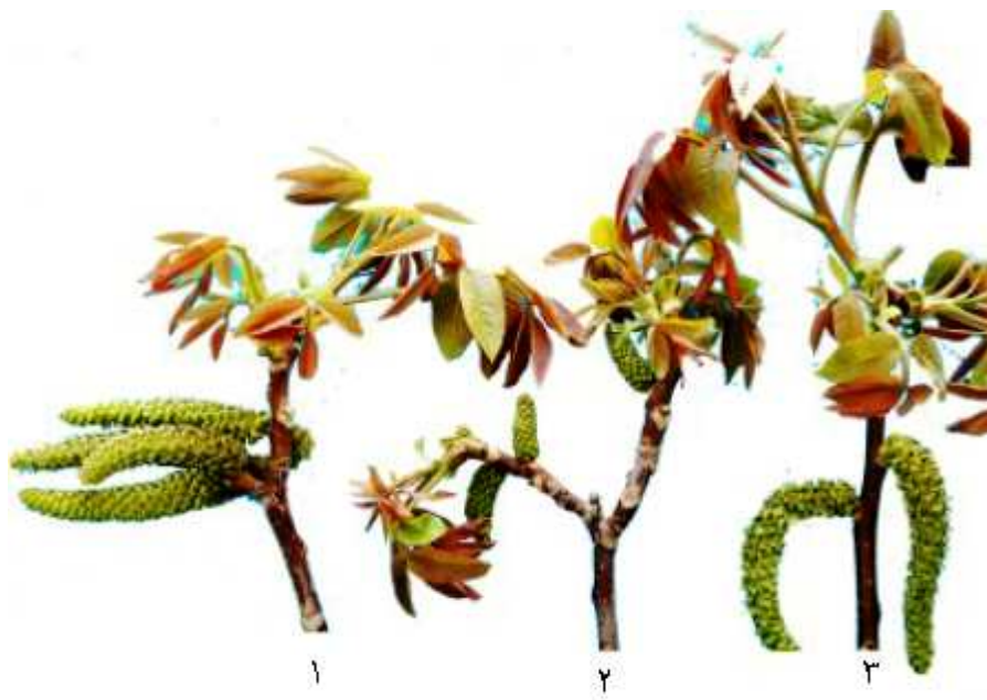
Fig. 1. Three kind of flowering habits as observed among studied genotypes: 1) Homogamous, 2) Protogynous and 3) Protandrous in which catkins going to be deteriorate, before female flower reception.

آن ها با دوره پذیرش مادگی همزمان باشد ولی اغلب نژادگان ها تمایل به گرده ریزی زودتر دارند و در برخی نژادگان های نادر هم شکوفایی گل های ماده زودتر از شکوفایی گل های نر صورت می گیرد (شکل ۱).