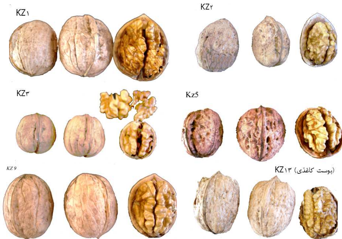
Fig. 2. Illustrations related to fruit, kernel color and shape in some of selected genotypes in 2006.

ویژگی های موثر در کیفیت میوه نیز در میان نژادگان ها متفاوت بود (جدول ۱ و شکل ۲). کمترین وزن میوه (۱۰/۳-۱۱/۸ گرم) و وزن مغز (۵/۵-۶/۴ گرم) مربوط به نژادگان های کم رشد با عادت باردهی جانبی مثل KZ3، KZ12 و KZ8 بود و بیشترین وزن خشک میوه (حدود ۱۶ گرم) مربوط به نژادگان های KZ1، KZ2 و KZ14 بود. چهار نژادگان KZ3، KZ11، KZ13 و KZ14 دارای روشن ترین مغز (۱/۶-۱/۳ از ۶) بودند. نژادگان های KZ3 و KZ13 دارای کمترین ضخامت پوست (کاغذی) و بیشترین درصد مغز (حدود ۶۰ و ۷۱٪) بودند.