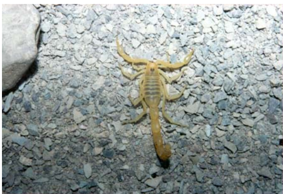
شکل ۲ عقرب ماده Buthacus leptochelys

این عقربها از خانواده Buthidae Simon, 1890 و دو جنس Buthotus Vachon, 1949 ( Hottentotta Birula, 1908) و Buthacus Birula, 1908 و بترتیب در دو گونه Buthotus jayakari (Simon, 1880) و Buthacus Leptochelys (Hemprich & Ehrenberg, 1829) تشخیص و تعیین هویت شدند. (نمونه هایی از گونه های مزبور در کلکسیون گروه حشره شناسی پزشکی دانشکده علوم پزشکی دانشگاه تربیت مدرس و موزه حشره شناسی دانشکده بهداشت و انستیتو تحقیقات بهداشتی دانشگاه علوم پزشکی تهران نگهداری می شود).