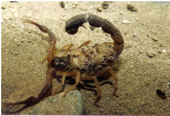
شکل ۱ عقرب ماده Buthotus jayakari به همراه نوزادان سن اول

بند آخر مزوزوما) و سپر سری (کاراپاس) اشاره کرد. اعضای باقیمانده بدن در این گونه به رنگ زرد روشن تا تیره می باشد. دم (متازوما) در این گونه غیر پشمالو بوده و تعداد دندانهای شانه در جنس نر ۳۶-۳۹ و در ماده ها ۳۲-۳۶ عدد است (شکل ۱).