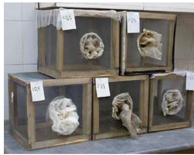
شکل ۱ سمت راست: قفس‌های نگهداری پشه‌های بالغ. سمت چپ: لیوانهای محتوی لارو