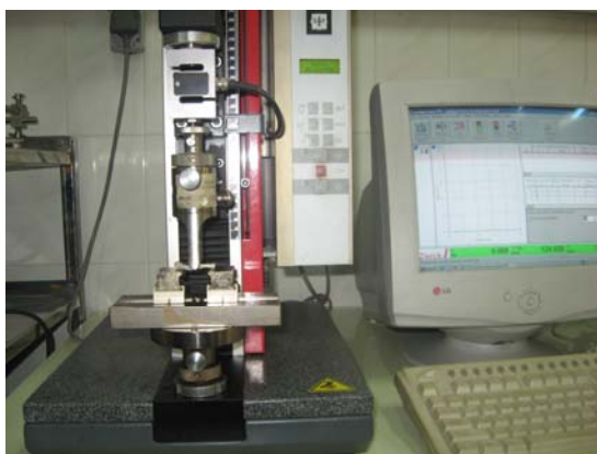
شکل ۱ دستگاه آزمایش سه نقطه

(stiffness، نیروی حداکثر (Maximum force) (N)، نیروی حداکثر در واحد سطح (Maximum force per square) (N/mm)، انرژی جذب شده (Energy Absorption) (N/mm)، نیرو در نقطه شکست (break) (Nmm) (Load at) هر یک از نمونه‌ها مشخص شد.