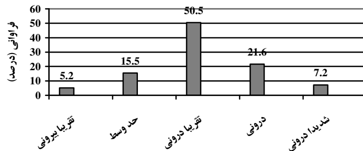
نمودار ۱: درصد فراوانی واحدهای مورد پژوهش از نظر نوع منبع کنترل در موقعیت‌های موفقیت

در خصوص نوع منبع کنترل بر حسب جنس، یافته‌های این مطالعه هیچ گونه تفاوت معنی‌داری را بین دو جنس از نظر منبع کنترل نشان ندادند. بدین معنی که نوع منبع کنترل در دو جنس تقریباً یکسان است. در خصوص ارتباط بین منبع کنترل و پیشرفت تحصیلی که هدف عمده این پژوهش نیز می‌باشد، آزمون ضریب همبستگی پیرسون هیچگونه ارتباطی را بین نمرات مربوط به منبع کنترل و میانگین نمرات دانشجویان نشان نداد، که این موضوع در مورد هر دو جنس صد می‌کند. همچنین آزمون تی نیز در تأیید یافته‌های فوق نشان داد که بین میانگین نمره مربوط به منبع کنترل در دو گروه دانشجویان با پیشرفت تحصیلی بالا و دانشجویان با پیشرفت تحصیلی پایین هیچگونه تفاوت معنی‌داری وجود ندارد.