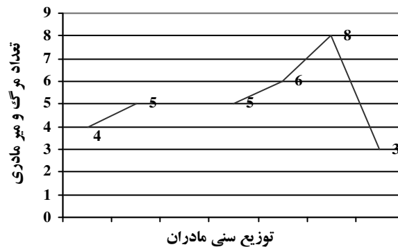
نمودار ۳: توزیع فراوانی مرگ و میر مستقیم مادری بر حسب سن در دهه ۷۰ در بیمارستان امام رضا (ع) مشهد