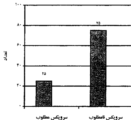
نمودار ۱: فراوانی نسبی دفع مکنونیوم در مادران دارای سرویکس مطلوب و نامطلوب

در ۵۸ مورد (۵۴/۱۶ درصد) نوزادان مکنونیومی حاصل نخستین زایمان بودند. بیشترین گروه سنی در طی این