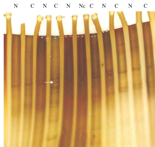
تصویر ۲: SSCP اکسون ۶ ژن P53 در نمونه‌های مبتلابه سرطان کولورکتال پیکان باند جابجا شده را نشان می‌دهد N: Normal Nc: Negative control C: cancer

در ژل اکریل امید انجام شد. روز بعد ژل به آهستگی از تانک خارج و با اسید استیک ده درصد به مدت ۲۰ دقیقه مجاورت داده شد و پس از شستشو با آب مقطر با نیترات نقره ۰/۱ درصد (Merk) در تاریکی ژل رنگ‌آمیزی شد، در پایان با محلول ظهور ۳ درصد (بی‌کربنات سدیم، تیوسولفات سدیم و فرمالدئید ۳۷ درصد) (Merk) باندها ظاهر شد و متعاقب آن ژل در اسید استیک ۱۰ درصد ثابت و از آن عکس تهیه گردید (شکل ۲) (۱۷،۲۲).