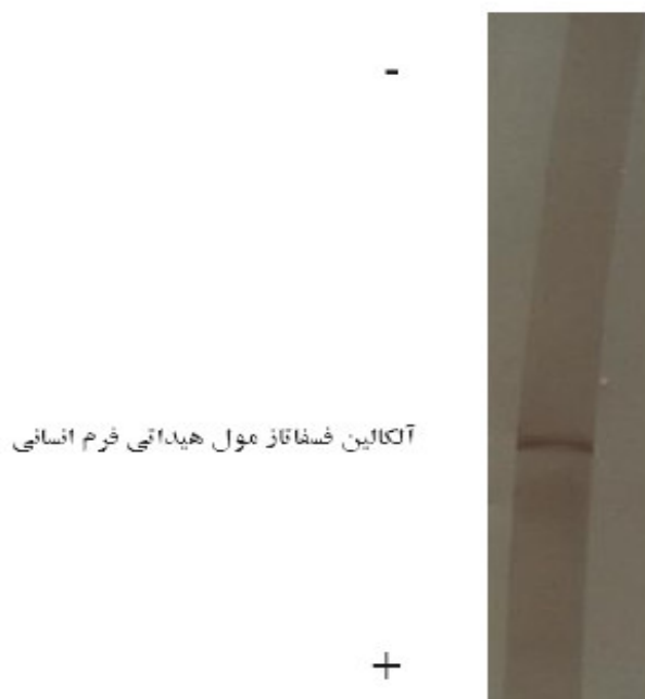
شکل ۲: SDS الکتروفورز از آلكالين فسفاتاز خالص شده از مول هيداتي فرم در بافر تريس با pH=۸/۲