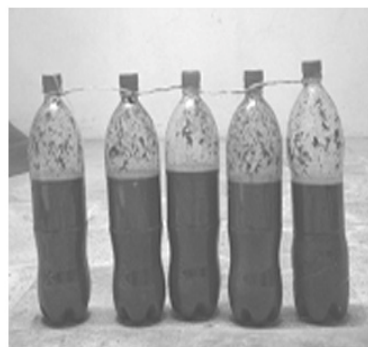
شکل ۱: باکتری‌های آماده شده در محیط مغذی برای راه اندازی سریع فرآیند