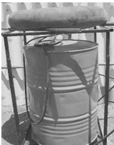
شکل شماره ۲: پایلوت بیوگاز راه اندازی شده