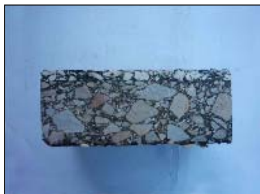
شکل ۳. مقطع اندود دولایه با محل شیار