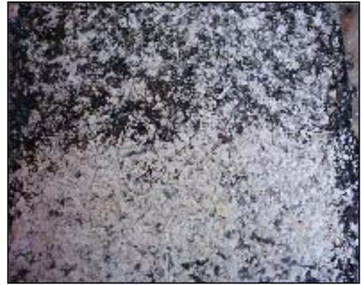
شکل ۴. بافت اندود سنگدانه‌ای گرانیت A

به منظور کم کردن خطای آزمایش، این آزمایش برای هر نمونه ۵ بار تکرار و عدد متوسط به عنوان BPN سطح یادداشت شد. نتایج مربوط به نمونه های مختلف و مقایسه آن با رویه های مختلف در جدول ۳ و شکل ۶ آورده شده است.