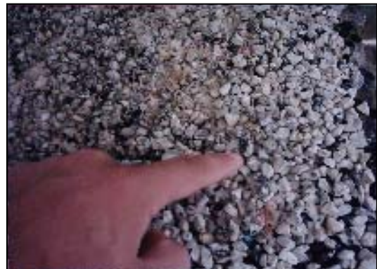
شکل ۱. اثر بار اضافی و خردشدگی سنگدانه‌ها،

قرار گیرند. برای مدل سازی چنین حالتی سعی شد تا تعداد دور رفت و برگشت دستگاه بیش از مقدار لازم باشد.