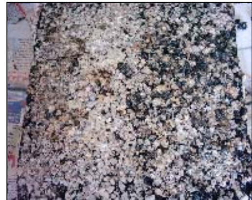
شکل ۵. بافت و مقطع اندود سنگدانه‌ای آهکی