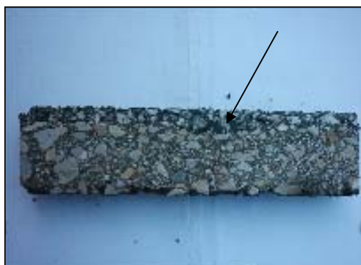
شکل ۲. میزان نفوذ سنگدانه‌های گرانیتی B