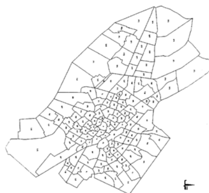
شکل ۱. ناحیه‌بندی ترافیکی حوزه مورد مطالعه (شهر مشهد) [۳۹]