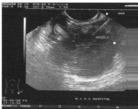
شکل ۱: تومور بدخیم در ناحیه سر پانکراس. سوزن بیوپسی مشخص است.

۲۶ بیمار جهت گرفتن بیوپسی از تومور پانکراس (۱۷ مرد و ۹ زن) مورد مطالعه قرار گرفتند که ۳ نفر توده دم پانکراس، ۴ نفر توده تنه پانکراس و بقیه (۱۹ نفر) توده سر پانکراس داشتند. در تمام این ۲۶ نفر FNA با موفقیت انجام شد (شکل ۱) که در ۱۶ بیمار (۶۱/۵٪) در همان جلسه پاسخ سیتولوژی تأییدکننده تومور بدخیم پانکراس بود. اسلایدهای ۱۰ بیماری که در آنها نتیجه منفی گزارش شده بود، توسط دو آسیب شناس دیگر در مرکز دیگری مورد بررسی قرار گرفت که در ۵ مورد وجود تومور بدخیم تأیید شد اما در ۵ بیمار (۱۹٪) دیگر گزارش اسلایدها از نظر وجود تومور در هر دو مرکز و توسط هر چهار آسیب شناس منفی بود. از بین این ۵ بیمار اخیر تومور در سی تی اسکن و آندوسونوگرافی چهار نفر نشان داده شد و شکی در مورد وجود آن باقی نبود؛ اما در یک بیمار گواهی تصاویر مربوط به سی تی اسکن و آندوسونوگرافی پیشنهادکننده تومور بود ولی با توجه به الکی بودن بیمار تردید در تشخیص وجود داشت، لذا بیمار به جراح معرفی و تحت عمل قرار گرفت. جراح نیز در حین عمل تشخیص تومور داد و از آن بیوپسی نمود، اما پاسخ آن پانکراتیت مزمن بود. چهار بیمار باقیمانده نیز با توجه به قطعی بودن تشخیص سرطان