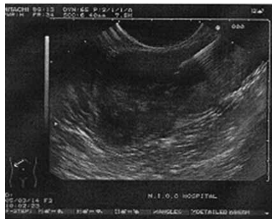
شکل ۲: تومور زیر مخاطی معده که با GIST مطابقت داشت.