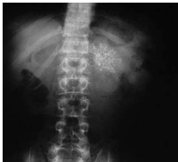
شکل ۱: عکس شکمی بیمار

سطح سرمی *CEA، **CA 19-9 و گاسترین ناشتا نیز طبیعی بود. در گاستروسکوپی انجام شده برای بیمار، زخم پپتیک و توده خاصی مشاهده نگردید. عکس قفسه سینه (CXR) هم، طبیعی بود. در عکس ایستاده شکمی، یک توده کلسیفیه در LUQ مشاهده شد (شکل ۱). جهت بررسی بیشتر، سی تی اسکن شکم انجام شد که در آن یک توده بزرگ کلسیفیه به قطر تقریبی ۶/۵×۷/۵ سانتی‌متر در ناحیه دم پانکراس گزارش گردید (شکل ۲). بیمار تحت آسپیراسیون سوزنی از پانکراس قرار گرفت و در پاتولوژی وی کارسینوم سلول شفاف (clear cell carcinoma) گزارش شد. بیمار تحت لاپاراتومی تشخیصی قرار گرفت. پس از لاپاراتومی، پانکراس با اندازه ۱۵×۱۵ سانتی‌متر، به‌صورت سفت و کلسیفیه مشاهده شد. امنتوم در روی پانکراس چسبندگی داشت. چسبندگی جدا شد و پس از لیگاتور کردن عروق خونی، پانکراس از ناحیه دم به سمت سر آزاد گردید. نمونه‌های متعدد گرفته شد و تمام پانکراس به جز ناحیه سر آن خارج گردید. در نهایت نمونه‌های گرفته شده جهت مطالعات ایمونوهیستوشیمی ارسال گردید. در بزرگنمایی متوسط از تومور، سلولهای توموری (با شکل و اندازه یکنواخت) به‌صورت دسته‌های کوچک و مجتمع مشاهده شدند