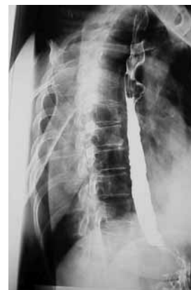
شکل ۳: یافته‌های ازوفاگوگرام زماندار آشنالازی