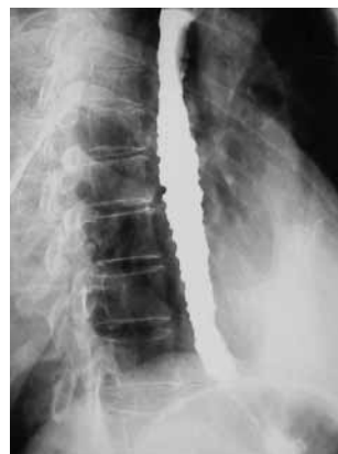
شکل ۴: یافته‌های ازوفاگوگرام زماندار آشنالازی

مشاهده نحوه پرستالسیس در تنه مری و شل شدن اسفنکتر تحتانی آن کمک‌کننده خواهد بود. ضمناً می‌توان از ازوفاگوگرافی زماندار، کمک گرفت. در این روش پس از بلع باریوم (۲۰۰-۱۰۰ cc) با اندازه‌گیری ستون باریوم به جامانده و قطر مری در زمانهای ۱، ۳ و ۵ دقیقه، مقدار باریوم باقیمانده را محاسبه می‌نمایند. این روش می‌تواند هم برای تشخیص و هم برای تعیین سیر بهبود بیماری انجام گیرد (شکل‌های ۳ و ۴). (۶)