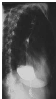
شکل ۲: یافته‌های رادیوگرافیک در آشنالازی