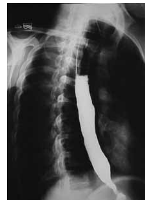
شکل ۱: یافته‌های رادیوگرافیک در آشنالازی

مشاهده نحوه پرستالسیس در تنه مری و شل شدن اسفنکتر تحتانی آن کمک‌کننده خواهد بود. ضمناً می‌توان از ازوفاگوگرافی زماندار، کمک گرفت. در این روش پس از بلع باریوم (۲۰۰-۱۰۰ cc) با اندازه‌گیری ستون باریوم به جامانده و قطر مری در زمانهای ۱، ۳ و ۵ دقیقه، مقدار باریوم باقیمانده را محاسبه می‌نمایند. این روش می‌تواند هم برای تشخیص و هم برای تعیین سیر بهبود بیماری انجام گیرد (شکل‌های ۳ و ۴). (۶)