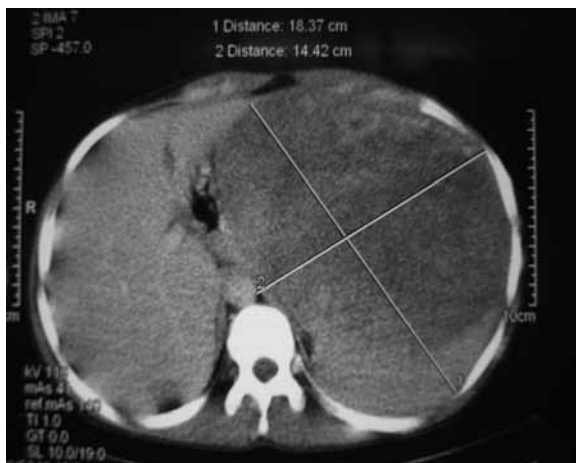
شکل ۱: سی تی اسکن بیمار با ماده حاجب

Corrected reticulocyte: 1.2% Albumin: 3.6 (3.5-5.2) gr/dl Total protein: 7.2 (6.2-8.2) gr/dl Wright, coombs Wright, mono test: negative ANA, Anti DNA (Elisa): negative