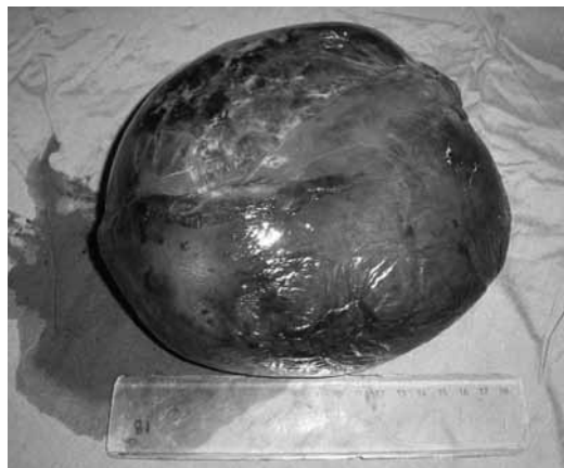
شکل ۲: طحال پس از جراحی

یافته های آسیب شناسی نیز در بیشتر موارد حکایت از تکثیر کانالهای عروقی بدون کپسول با اندازه های مختلف از کاپیلر (مویرگی) تا کاورنوی (حفره ای) دارد و بیشتر ضایعات کمتر از ۲ سانتی متر هستند. (۳)