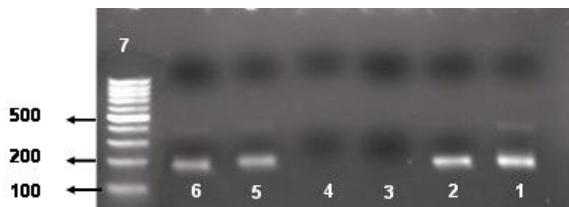
شکل ۱: مقایسه استخراج ژنوم ویروس با دوروش کیت دستی

QIAamp Viral RNA Mini Kit، استخراج گردید، که نتایج یکدیگر را تایید نمودند (شکل ۱).