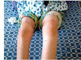
شکل ۲: پتشی و پورپورای اندام تحتانی بیمار

بیمار در روز پنجم بستری دچار درد و ادم یک طرفه اندام تحتانی چپ به همراه پتشی و پورپورای همان ناحیه گردید (شکل ۲).