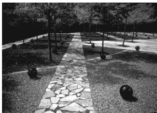
تصویر ۵- ۱۹۸۸ Center for Innovative Technology

هوبارد وکیمبال نیز معماری منظر را هنری ظریف تعریف کرده اند و مهم ترین عملکرد آن را ایجاد و حفظ زیبایی در مجاورت سکونت گاه بشر و در مقیاس بزرگتر گسترش چشم انداز های طبیعی اطراف و همچنین ارایه دهنده آسایش، راحتی و بهداشت برای شهر نشینان دانسته اند تا آنان بتوانند برای تجدید قوا و کسب آسایش و آرامش به چشم اندازهای روستایی دسترسی داشته باشند(۸).