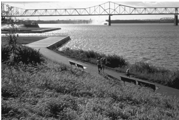
تصویر ۳- ۱۹۹۰ Louisville Waterfront

هر کدام از عوامل فوق در ارتباط با هدف تحلیل و ساختار ذاتی منظر قرار می گیرد. برای مثال، در یک سامانه رودخانه ای می توان ارتباط سامانه هیدولوژی با ساختار بستر رودخانه را توسط فرایندهای مختلف مشاهده کرد. با این حال از آن جا که هر ناحیه ای معمولاً جزیره ای جداگانه از محیط اطرافش نیست، در تحلیل نباید الگوهایی با مقیاس های بزرگتر و کوچکتر از منطقه را نادیده گرفت.