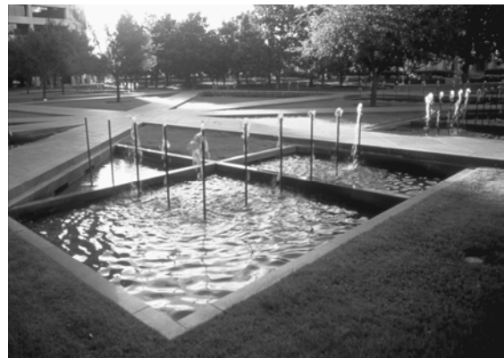
تصویر ۲- اثر پیتر واکر ۱۹۸۳ Burnett Park

بدون تردید یکی از جدی ترین و مهم ترین ارزش ها و رویکردهای معماری منظر کارکردهای اکولوژیکی آن است، این رویکرد در واقع از بستر اصلی این گرایش نشأت می گیرد که طبیعت است. و از آن جایی که معماری منظر در بخشی از وظیفه خود به عنوان یک علم که در طراحی، مدیریت و برنامه ریزی محیط های باز فعالیت دارد و می تواند منشأ تغییرات و تحولات مثبت و یا منفی باشد، پرداختن به