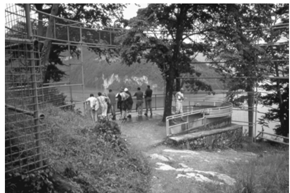
تصویر ۶- ۱۹۹۰ Voie Suisse, Lake Brunnen

از چندین دهه پیش تاکنون تلاش های متعددی شده تا مردم را در فرآیند های تصمیم گیری در خصوص مکان هایی که در آن ها زندگی، کار و استراحت می کنند سهیم نمایند.