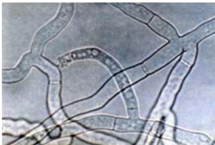
شکل ۳- ریشه قارچ R. solani