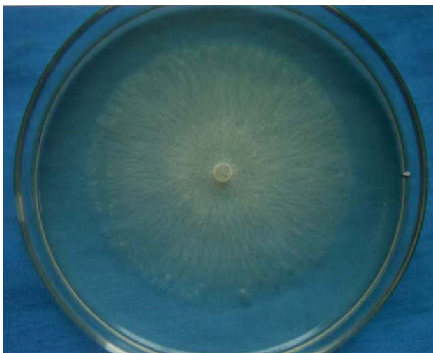
شکل ۱- نحوه رشد میسلیوم R. solani روی محیط کشت PDA (کشت ۳ روزه)