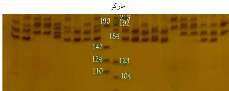
شکل ۱. الگوی باندها برای جایگاه MCMA2