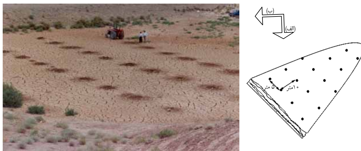
شکل ۲. محل‌های نمونه برداری در مخازن سدها (الف) و نمونه‌ای از مناطق حفر چاهک‌های گمانه‌ای در مخزن سد عمران (ب)