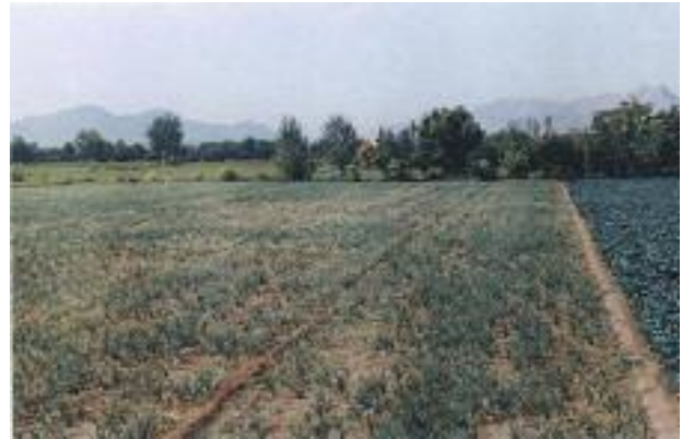
تصویر ۱. مزارع آلوده به بیماری ریشه سرخی پیاز در اصفهان