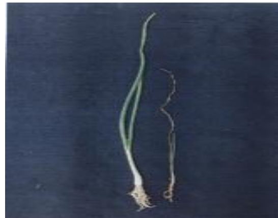
تصویر ۲. گیاهچه‌های پیاز آلوده به بیماری ریشه سرخی (بالا)، پیازهای بالغ آلوده به بیماری (پایین)

و بنفش رنگ شده و از بین رفته بودند و به راحتی از طبق گیاه پیاز جدا می‌شدند. در این خصوص، دو توده صفی‌آباد رامهرمز و سرباز بلوچستان قرار داشتند و از لحاظ طبقه‌بندی در طیف سوم (۲-۳) واقع شدند. این دو توده، از حساس‌ترین توده‌های مورد آزمون در این بررسی‌ها هستند که در این جا معرفی می‌گردند. بررسی‌هایی که سایر پژوهشگران در این خصوص ارائه نموده‌اند نیز به همین صورت عمل نموده و بعضاً در شرایط مزرعه و یا به صورت پلات‌های کوچک آلوده، انجام داده‌اند و ارقام و توده‌های مورد آزمون مربوطه خود را نسبت به این بیماری ارزیابی کرده‌اند (۸، ۱۰، ۱۱، ۱۴، ۱۵ و ۲۶).